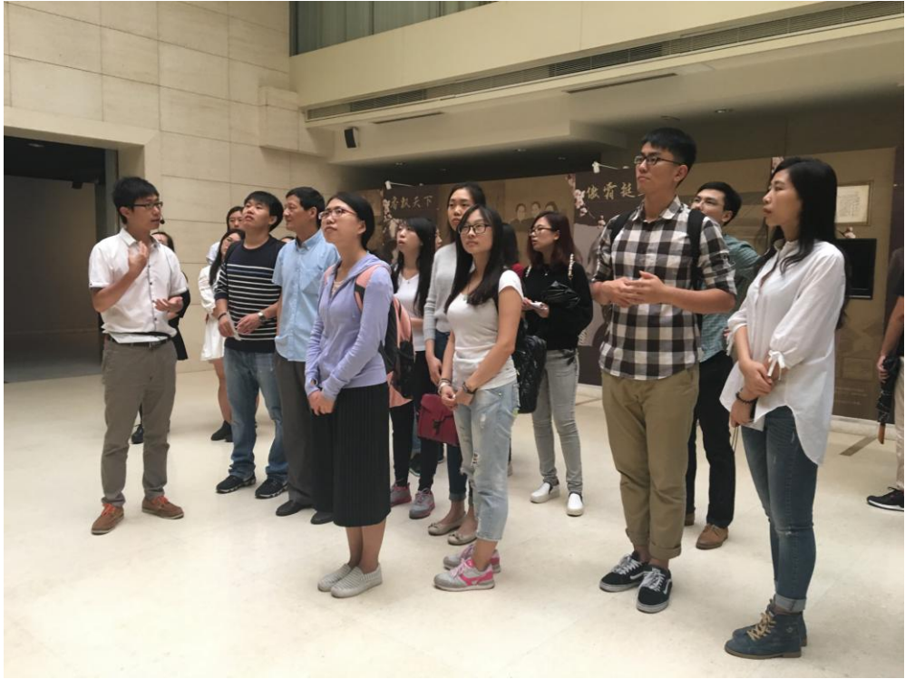
参观宋庆龄纪念馆时聆听讲解