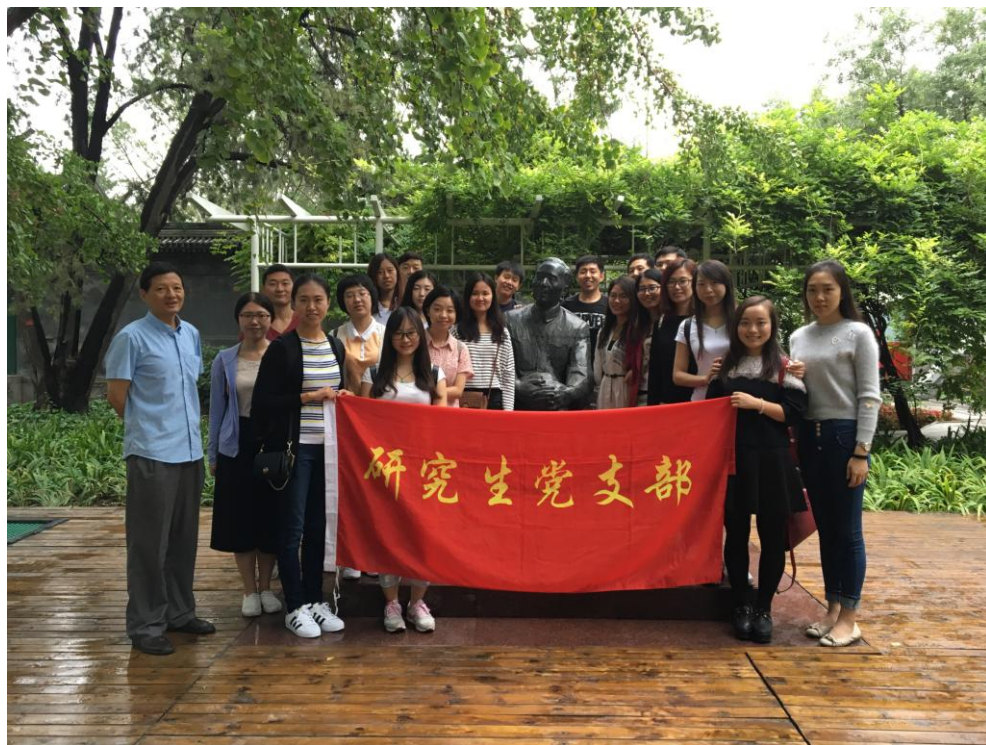
郭沫若先生雕像前的合影

参观名人故居是传统的爱国主义教育形式，也是支部作为新学期实践教育方面的部署。本次活动有助于新党员与入党积极分子更快融入组织集体。活动归来，同学关系更加紧密，沟通交流增多。实地走进爱国民主革命人士的生活环境、了解近代革命进程，体会新中国在政治道路走向、科学文化建设方面之不易，青年党员深刻感悟到要更加珍惜社会主义现代化建设所取得的巨大成就，同时以更加饱满的精神状态投入科研学习中。本次参观郭沫若纪念馆和宋庆龄通知故居活动取得圆满成功。