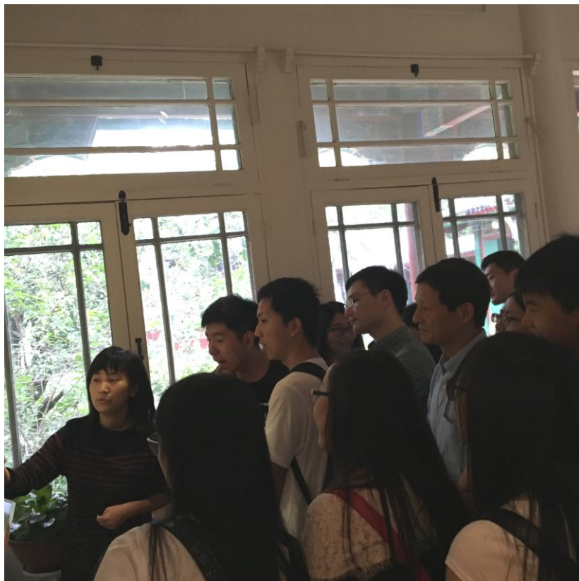
参观郭沫若纪念馆聆听讲解